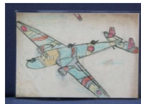
戦時中の男の子が描いた絵