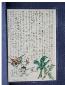
出征の父からの手紙