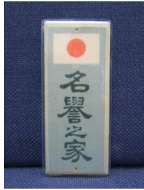
名誉の家プレート