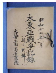
戦時中のスクラップブック