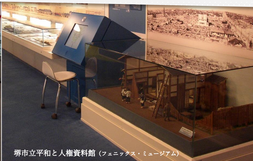
堺市立平和と人権資料館 (フェニックス・ミュージアム)

2022(令和4)年 10月1日(土) ~ 2023(令和5)年 2月5日(日)