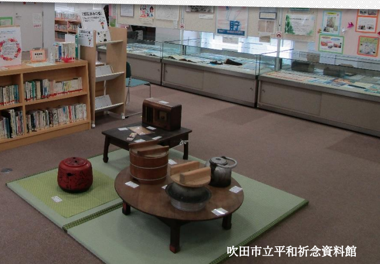
吹田市立平和祈念資料館