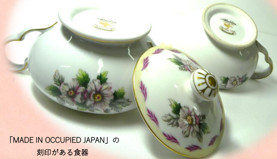
「MADE IN OCCUPIED JAPAN」の刻印がある食器