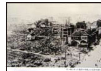
四ツ橋にあった電気科学館より北西を望む