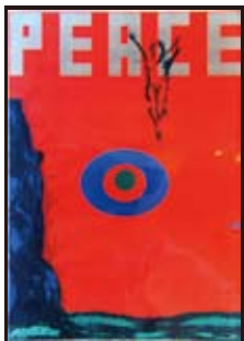
ピースおおさかポスター