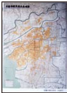
空襲の被災状況 (大阪市)