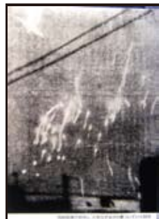
高射砲弾が命中し、火を吐きながら落ちていく B29