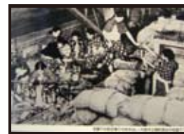
空襲下の防空壕での炊き出し（大阪市立扇町高女の校庭で）