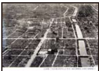
日本橋1丁目交差点を中心とする一面の焼野原 (右側が道頓堀川)