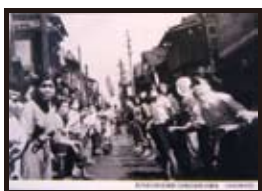
町内会の防空演習（旧南区坂町30番地 1942年6月）