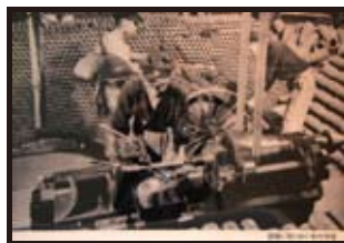
施盤に取り組む勤労学徒