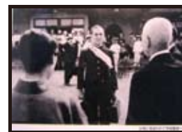
父母に見送られて学徒動員へ