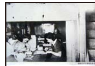
壕舎の中で事務を執る