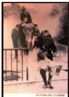
象も防空演習に参加（天王寺動物園）