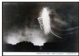
焼夷弾は空中で破裂し、密集する木造家屋に火の油をそそいだ