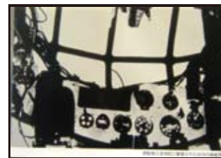
堺筋南久宝寺町に撃墜された B29 の操縦席