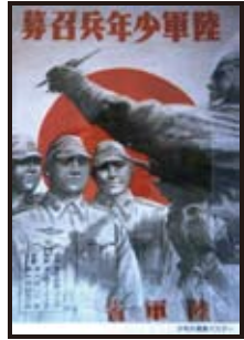
少年兵募集ポスター