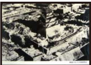
廃墟と化した大阪城周辺