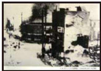
くすぶりつづける堺筋 (1945年3月14日朝)