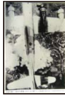
大阪を襲う「超空の要塞」B29 右主翼下に大阪城が見える (1945年6月1日)