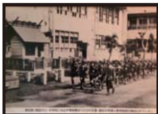
奉安殿（戦前の小・中学校には必ず奉安殿がつくられ天皇・皇后の写真と教育勅語が納められていた）