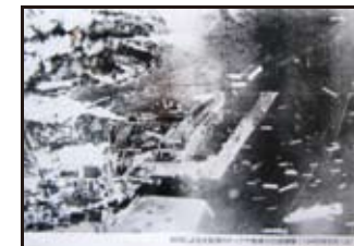
B29による大阪港のドックや倉庫の白昼爆撃 (1945年6月1日)