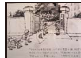
『われら大日本青少年団 いざ共に聖恩の旗仰ぎつつ』町内会ごとに分団がつくられ、『歩調とれ一ツ』と登校。学校にもミニ軍隊の兆し。（昭和18、9年頃）