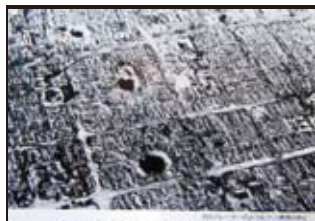
月のクレーターのような1トン爆弾のあと